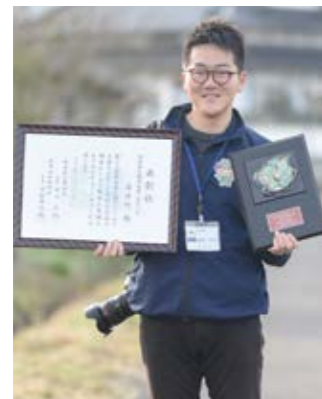
いつも取材にご協力いただきありがとうございます

第63回熊本県広報コンクールの最終審査が1月15日に熊本市の熊本日日新聞本社であり「広報湯前」が広報紙・町村の部で1位となる特選に7年連続で選ばれ、熊本県広報協会を受賞。組み写真の部でも初の特選を受賞しました。 コンクールは市町村広報紙のレベルアップを目的に開催され、県内自治体の広報担当課でつくる県広報協会と熊日日新聞社が主催。県内の市町村から広報紙の部に22点、広報写真・組み写真の部に119点の応募がありました。 本町は広報紙の部に令和元年9月11月号、組み写真の部には里宮神社の紅葉ライトアップイベントを撮影した同12月号の8、9ページを提出。紙面は審査員から「すべての分野でワンランク上」「特集は地域の課題を捉え取材力もすばらしい。この町に住んでみたいと思わせる」「写真は明るくて気持ちが良い。空き具合が計算された美しいレイアウト」などと評価されました。11月号と組み写真はことし5月に行われる全国広報コンクールに熊本県代表として出品されます。 町村の部では球磨村やあさぎり町、写真の部でも人吉市などが入選し人吉球磨郡市勢の活躍が光りました。