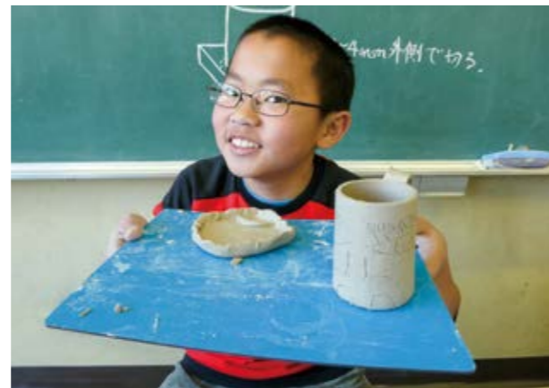
↑記念品作りを笑顔で楽しんだ児童

卒業を記念する陶芸教室が2月6日に湯前小学校で開かれ、6年生36人が老人クラブ陶芸部会の会員8人から教わり、マグカップを製作。模様をつけるなどして個性あふれる作品ができました。