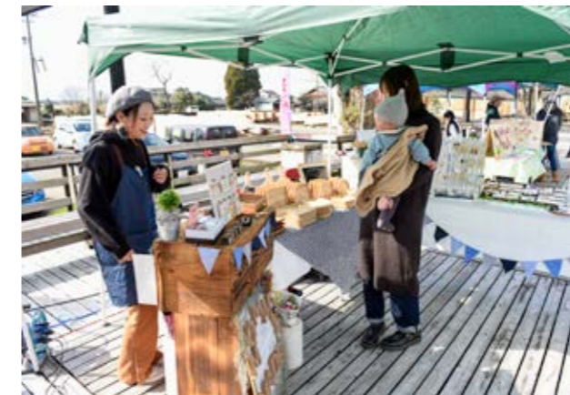
↑かわいい小物が並ぶお店

2月9日、「バレンタイン前にきれいになろう」をテーマにルールウイングでイベントが開かれました。ハンドメイドの小物や飲食の販売、ハーバリウム・キャンドル作り体験など14店でにぎわいました。