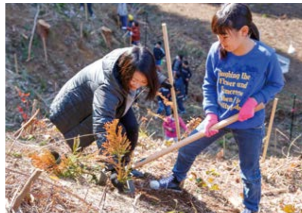
↑親子で会話をしながら仲良く植林

湯前小学校6年生と保護者70人が2月10日に田上の町有林(尾谷～大谷)で卒業を記念した植林を体験し、スギの苗木350本を植えました。手を動かしながら会話を弾ませ、笑顔で汗を流していました。