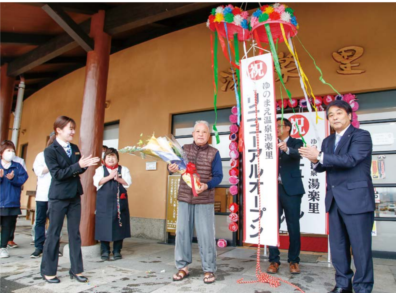
来館者とともに新たなスタートを祝う関係者