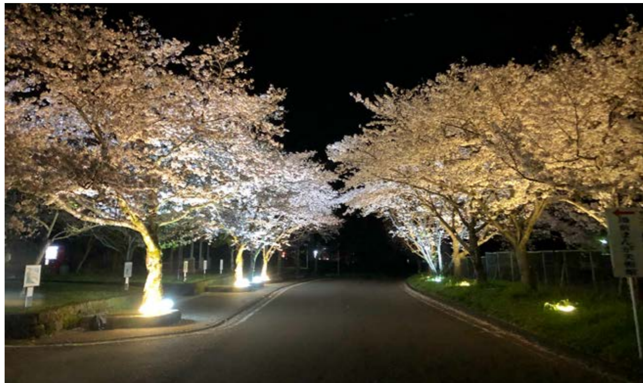
幻想的に彩られたまんが美術館前の桜

中止はせず、告知なしの開催に 昨年の春、まんが美術館前の桜を試しにライトアップしてみました。予想以上に良い風景になったので、ことしはイベントとしてライトアップをしようと思った矢先に感染症の問題が発生しました。中止にするかどうか迷ったのですが、周りからの後押しやご協力もあり、告知はあえてせずに一週間ほど開催することができました。桜のライトアップをたまたま見かけた人の心のリフレッシュになったのであれば幸いです。来年度もこのライトアップに携われるようであれば、たくさんの方が夜桜を楽しめるようなイベントをつくれたらと思います。 ことしは荒波の一年になるでしょうが、来年の桜を、また良い気持ちで見られるように頑張りたいですね。