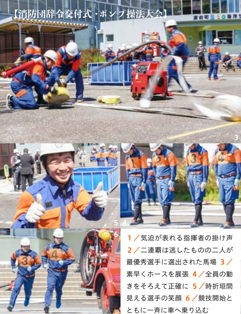
1 / 気迫が表れる指揮者の掛け声 2 / 二連韋は逃したものの二人が最優秀選手に選出された馬場 3 / 素早くホースを展張 4 / 全員の動きをそろえて正確に 5 / 時折垣間見える選手の笑顔 6 / 競技開始とともに一斉に車へ乗り込む