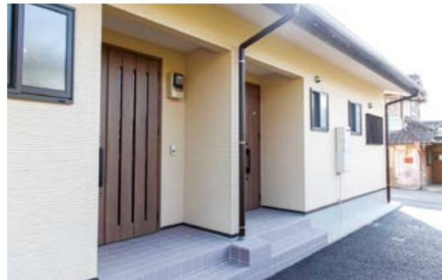
湯前駅から徒歩3分の好立地

昨年度本町が中里2区の町有地に建設していた若者向け住宅「中里団地」(1棟3戸)が3月に完成。2棟6戸すべての建設が完了しました。