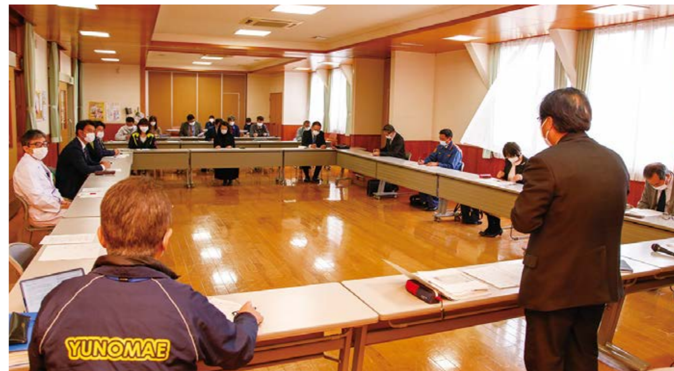
各機関の状況や今後の対策について情報を共有した出席者