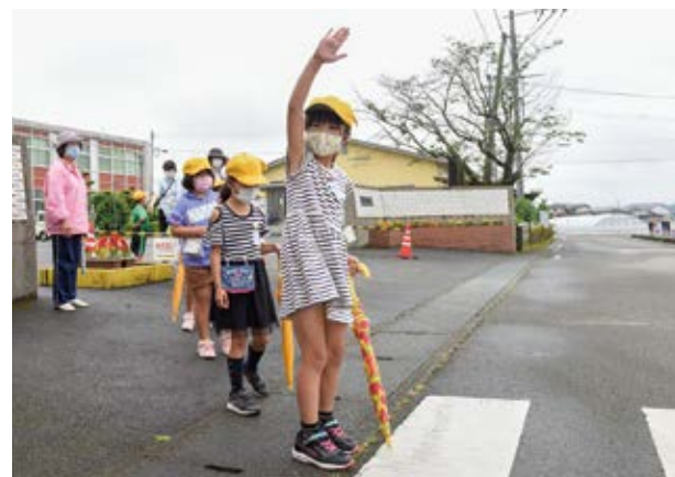
↑「右見て左見て右見て渡れ」を合図に歩道を渡る児童

安全に登下校するための交通安全教室が6月4日に湯前小学校で開かれました。全校児童182人は交通安全母の会4人から指導を受けて歩道を渡るなどして自分の命を守るためのルールを学びました。