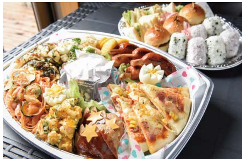
パーティープレート大 4000円 小 2000円

子ども会や誕生日会で人気のプレート。手作りピザは子どもも大人も大喜び。かわいく飾り付け、彩りも豊か。3日前までに予約をすれば名物ユノバーガーの半分のサイズの「キッズバーガー」も入れることができます。内容は要望に応じます。