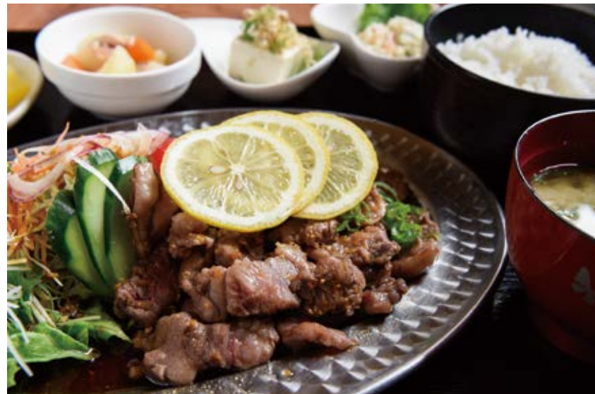
レモンステーキ定食 1200円

ボリューム満点のステーキに自家製和風ステーキソースを絡めて、レモンをプラス。肉のうまみとさわやかな果汁が絶妙。ジューシーなのにさっぱりと食べられます。名物のチキン南蛮に追いつく勢いで人気急上昇中の一押しメニューです。