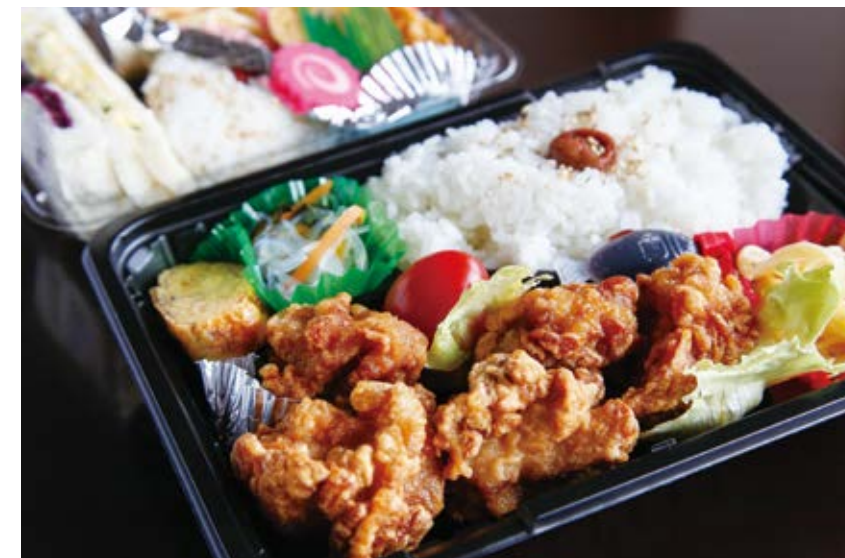
週替わり弁当 450円～ サンドイッチ・おにぎり弁当 350円

コメリ湯前店横の元ランドリーハウス敷地内で週2回、弁当や惣菜を販売。週替わり弁当はドライカレー、ハンバーグ、ロコモコ、鳥そぼろ、チキン南蛮などから2種類ずつ。から揚げはふっくらジューシーで大満足の量。お店でのランチも提供。