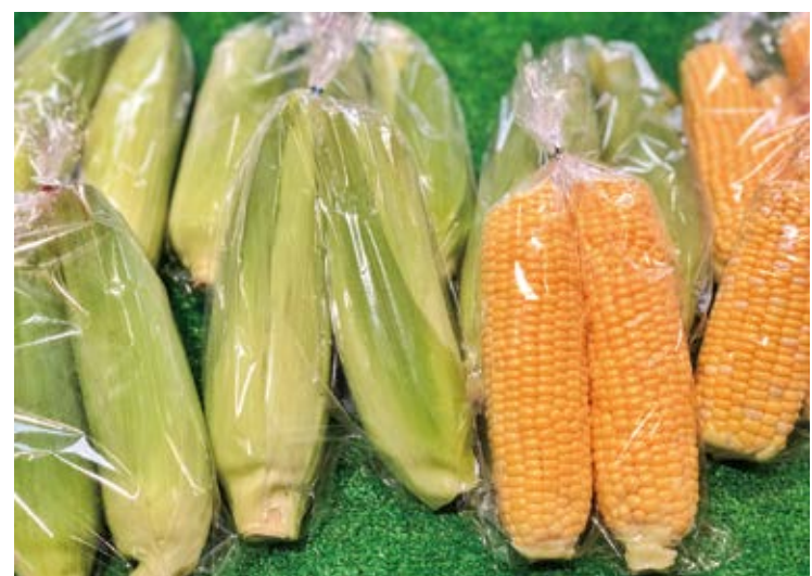
湯〜とぴあには夏の代名詞トウモロコシの姿も

夏がやってきました 普段、湯前駅横の「湯〜とぴあ」にいます。生産者が持ってきた野菜を見ていると、だんだん夏らしい商品が多くなってきましたと感じています。最近までまだまだ寒いと思っていたのにあつという間に7月。ことしは時間が過ぎるのがとても早い気がします。これからまたあつという間に除夜の鐘の音が聞こえてきそうなので時間を大事に過ごしていきたいと思えました。