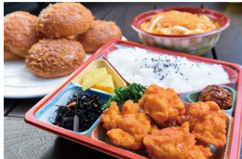
からあげ弁当 540円～、カツ丼 750円、揚げたてカレーパン 300円

カレー、どんぶり、名物のチャンポンなど、店内メニューの約9割が出前可能。注文後すぐに配達できるお弁当も6種類と豊富。町内、水上、多良木まで、1個から注文でき、一人暮らしの人でも気軽に「できたて」を味わうことができます。