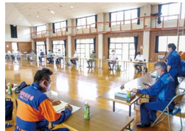
↑情報を交換し連携を強化する関係者

6月2日、本町は梅雨入りを前に防災会議を農村環境改善センターで開き、地域団体や熊本地方気象台、自衛隊など27団体37人が出席。「町防災計画」の追加・修正を説明し、各団体が意見を交わしました。