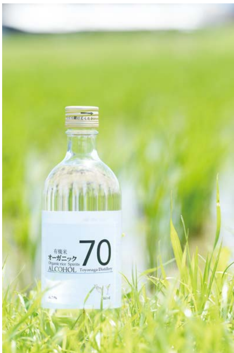
飲んでも楽しめ、消毒用としても体に優しい1本