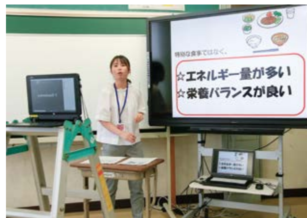
↑画面越しに栄養バランスや体への効果を指導

湯前中学校の生徒84人は6月15日に栄養教諭から「スポーツと食」についてオンラインで学びました。