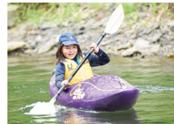
↑パドルを器用に動かしてすいすい進む児童

B&G湯前海洋クラブが6月6日に開校。児童と指導者ら7人が養谷ため池で水辺の安全を学び、カヌーを体験しました。全員が次第にコツをつかみ、すいすいと遠くまで移動できるようになりました。