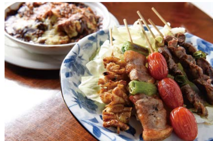
焼き鳥1本140円〜、ベイクドカレー800円(カツ+100円)

人気の豚バラ、つくね、砂ずり、鳥皮をはじめ、16種類の焼き鳥がずらり。チーズをのせてオーブンで焼き上げるベイクドカレーは常連にもおなじみ。とんかつプラスでさらに美味。一度食べるとやみつきに。テイクアウトもおすすめです。