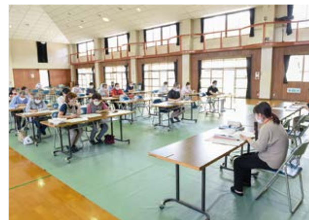
↑町職員の説明に耳を傾ける参加者

コロナの影響を受ける商工業、農林業者への支援制度の説明会を6月10日に農村環境改善センターで開き、23人が国、県、町の支援制度の対象条件や申請方法などについての説明を町職員から受けました。