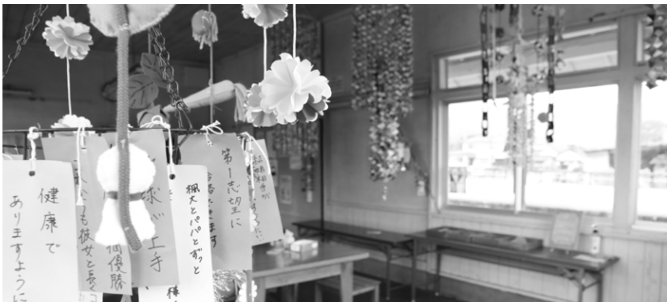
↑商工会女性部が毎年飾りつけている七夕飾り。7月末まで湯前駅舎内に飾られます。※大雨の影響で駅舎は閉館しています。(7月8日現在)