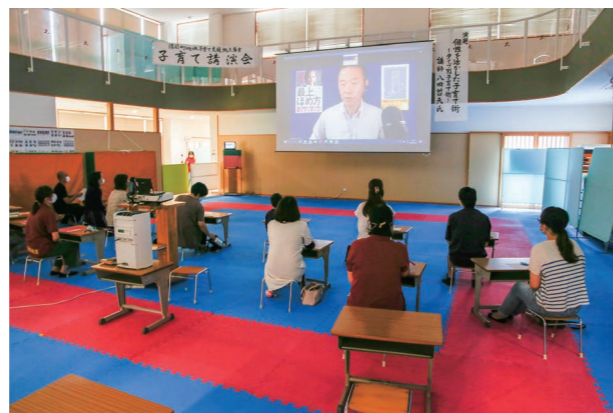
オンラインで講演を受ける参加者

子育て支援拠点事業として慈光こども園が定期開催する子育て講演会が9月12日に同園で開かれ、保護者ら17人が参加。心理学を活用した3つのタイプの行動や心理を講師が紹介し、参加者は我が子の顔を思い浮かべながら個性との向き合い方を考えていました。