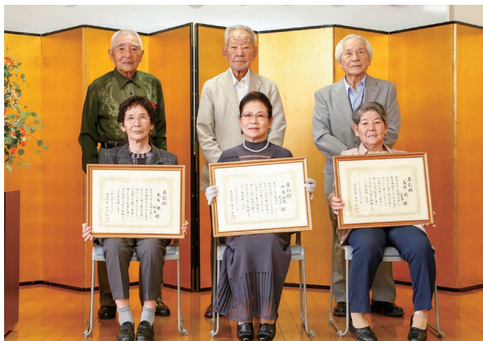
互いに長年の感謝を伝えたダイヤモンド婚夫婦