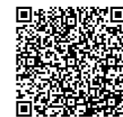
中村さんの動画はこちらから

9月11日に湯前小学校の6年生25人が動画を視聴。「東京から湯前のことを思って応援してくれていることがうれしかった」「僕たちも毎日元気に過ごして頑張ろうと思った」と、遠く離れた地から応援してもらえるありがたさを感じていました。動画はQRコードから読み取るか、町B&G海洋センターのFacebook ページでも見ることができます。