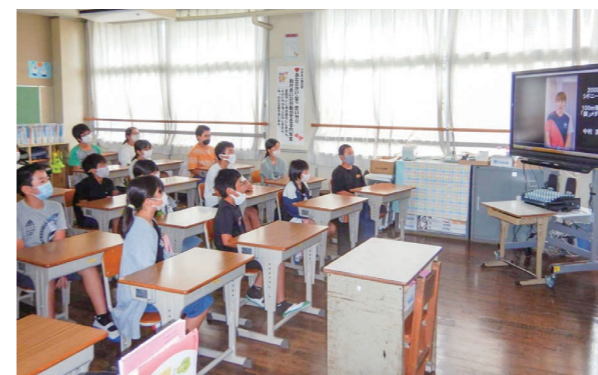
中村さんのメッセージに元気もらった児童たち

令和2年7月豪雨を受けて、シドニー五輪100m背泳ぎの銀メダリストでB&G財団で理事の中村真衣さんが本町に応援メッセージを送ってくれました。*