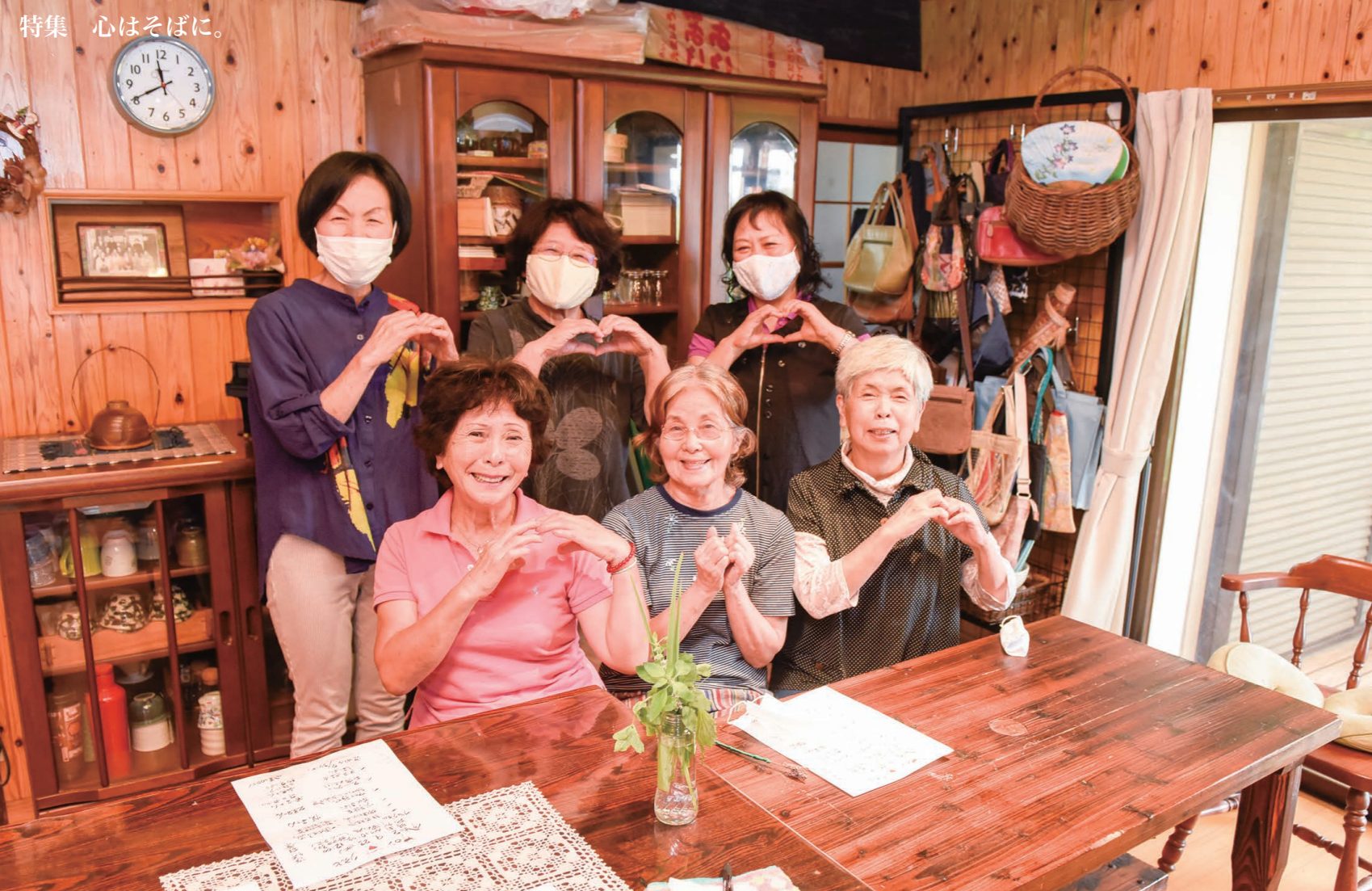
顔を合わせて、手を取り合うことが前を向いて生きる力に