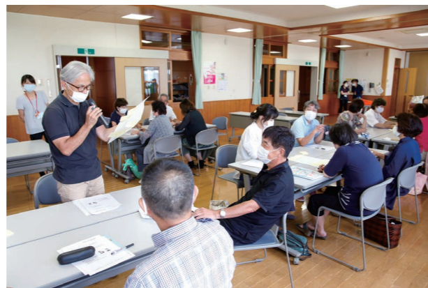
接し方の良し悪しを話し合って発表する会員

本町の有償ボランティアグループ「ゆのまえちょこっとボランティアささえあい」は9月10日に保健センターで定例会を兼ねた研修会を開催し、会員24人が認知症サポーター養成講座を受講。「自尊心を傷つけず、主張を受け入れる」などと接し方を学んでいました。