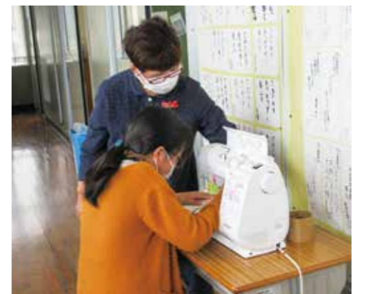
ミシン1台に1人ついて熱心に指導