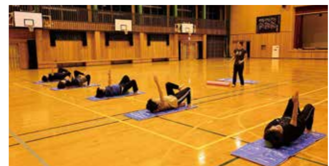
みんなで無理なくトレーニング

湯前さわやかクラブ「だんだん」でストレッチ&体幹トレーニング教室を開催中です。ストレッチや体幹・筋力トレーニングで、肩こり・腰痛・ひざ痛予防と美姿勢を目指します。思うように運動ができていない人、新しいことを始めてみようと考えている人など参加してみませんか?