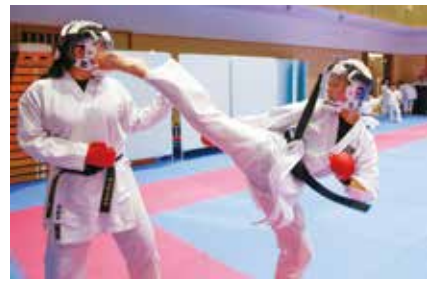
迫力のある蹴りを打ち込む