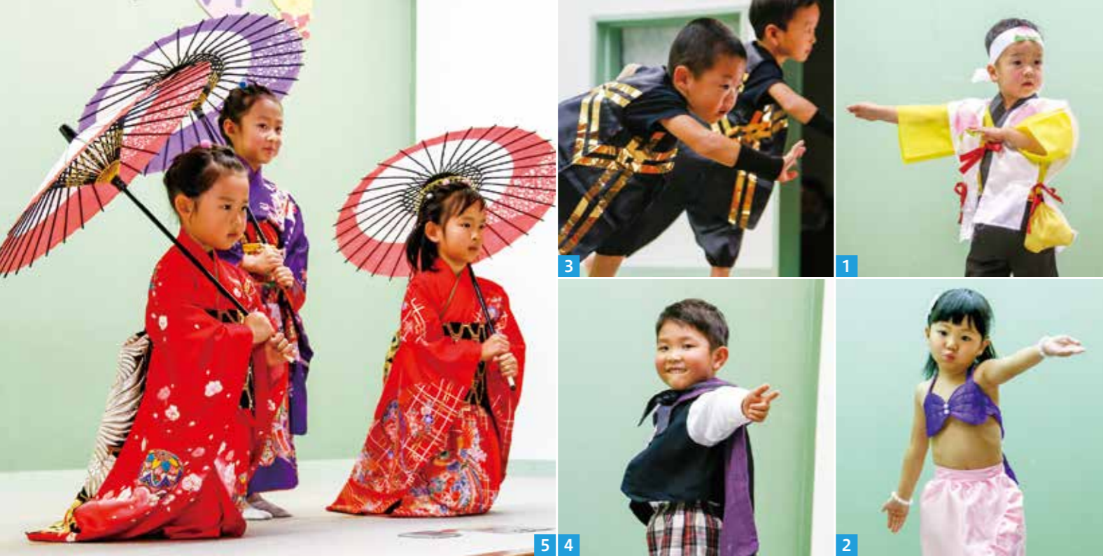
1.4.7.11_バシッと決めポーズ 2_私の投げキッス受け取って 3_キングオブ男! 5_園児とは思えない妖艶な舞を披露 6_びよびよん