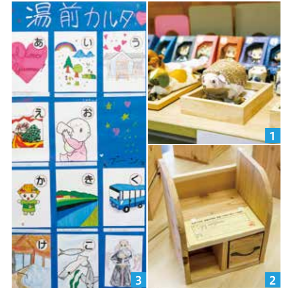
1.2.3_校舎内には展示物がたくさん並ぶ 4_英語パフォーマンスにはALTのギャレットさんも参加 5_オープニングを飾る吹奏楽部のビッグバンド 6_1年生の発表では某有名番組のパロディも 7.8_男子も女子も楽しくダンス