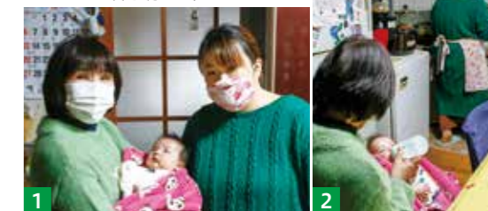
1_親も子も安心 2_おとなしくミルクを飲む赤ちゃん

※ゆのまえちょこっとボランティア「ささえあい」 支援のご相談は社会福祉協議会へ ☎0966(43)4117