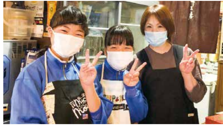
職場体験では事業者の皆さんにも喜んでもらえました

体で子どもたちを育てることができれば、子どもたちももっと町を好きになっていくことでしょう。 互いに支え合いつくりあげる 本部では子どもたちが地域を支援する活動も計画しています。支援をするという経験や支援を通して周りの人に喜ばれている、頼りにされていると感ずることが、成長にとって何より大事なことです。地域と学校が互いに支え合い、自分たちの力で地域や学校をつくりあげていく。子どもたちの将来と町の将来のために、地域と学校をつなぐ架け橋となるために、本部の活動はこれから大きく広がっていきます。