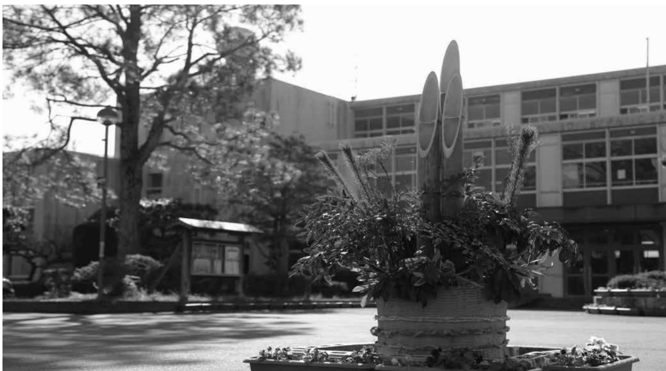
↑学校に立派な門松が立ちました。今年もよろしくお願ひします。