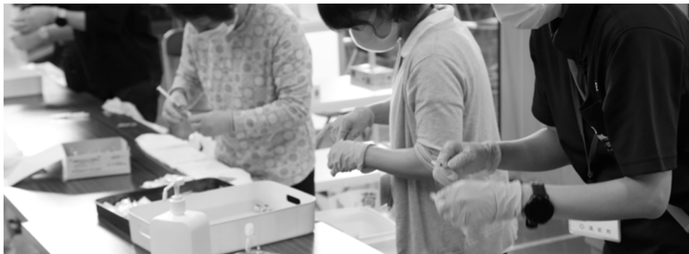
5月18日から新型コロナワクチン接種始まっています

市外(内) 0966(43) 役場 ☎ 4111 B&G海洋センター ☎ 4555 保健センター ☎ 4112 中央公民館 ☎ 2050