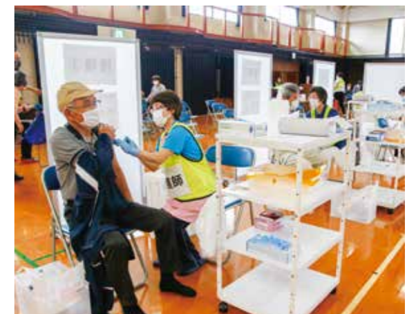
5月18日、集団接種初日の様子