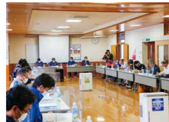
防災計画の説明に耳を傾ける