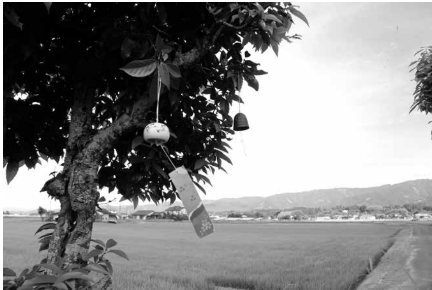
風鈴の音を聞いて暑い夏を乗り切りましょう