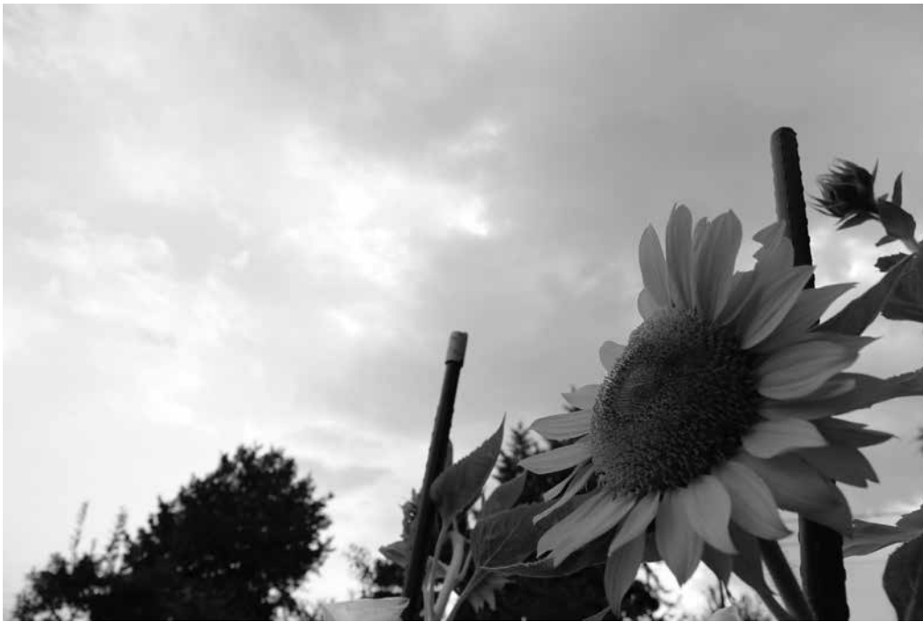
ひまわりの成長を見ていると秋の足音を感じます