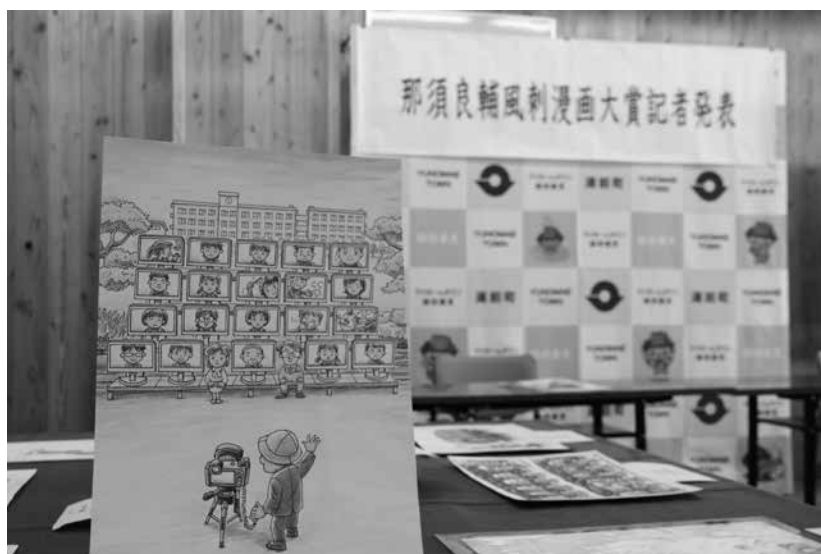
第30回那須良輔風刺漫画大賞の記者発表がありました。作品名「集合写真」

市外(内) 0966(43) 役場 ☎ 4111 B&G海洋センター ☎ 4555 保健センター ☎ 4112 中央公民館 ☎ 2050