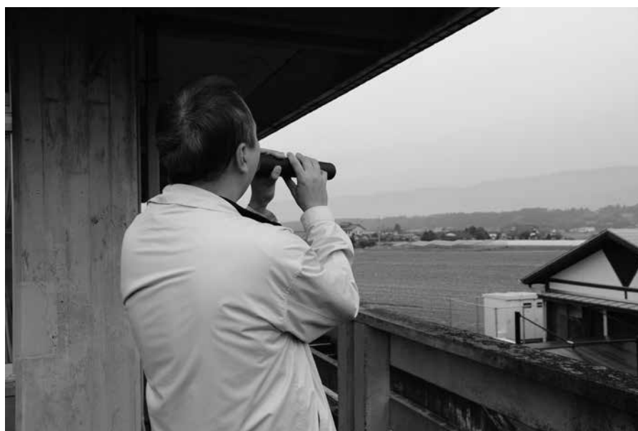
関西から広まった恵方巻。今年の食べる方角は「北北西やや北」です。

市外(内) 0966(43) 役場 ☎ 4111 B&G海洋センター ☎ 4555 保健センター ☎ 4112 中央公民館 ☎ 2050