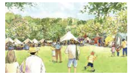
まち山エリア(立山)