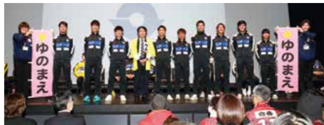
湯前町を担当する9選手と記念撮影