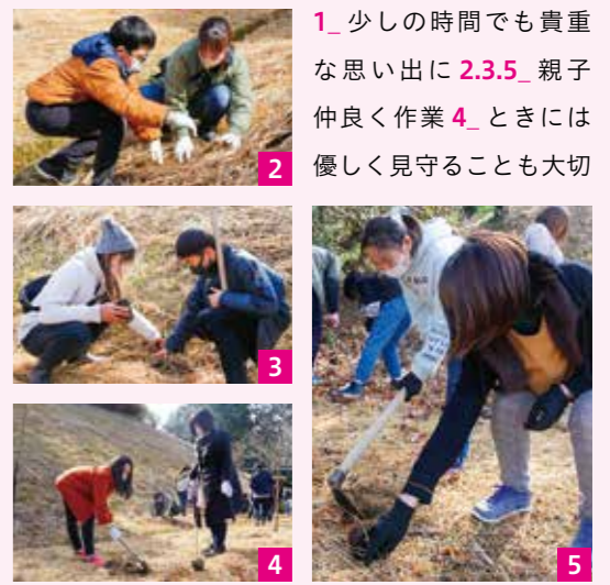
1_ 少しの時間でも貴重な思い出に 2.3.5_ 親子仲良く作業 4_ ときには優しく見守ることも大切

2月14日、湯前小学校記念植林があり、同校の6年生児童31人と保護者が参加。親子で協力して、元「湯芽科房」横の町有林に「ヤマモミジ」「イロハモミジ」を計40本植えました。卒業を控える子どもたちにとって、貴重な親子での作業となった今回の植林。子どもたちは「家族と貴重な体験ができて良かった」「家族との良い思い出になった」「お父さんとニコニコしながら作業ができて楽しかった」など感想を話しました。今回の植林で植えられた木々は、長い年月をかけて子どもたちの成長とともに大きく育ってゆくことでしょう。