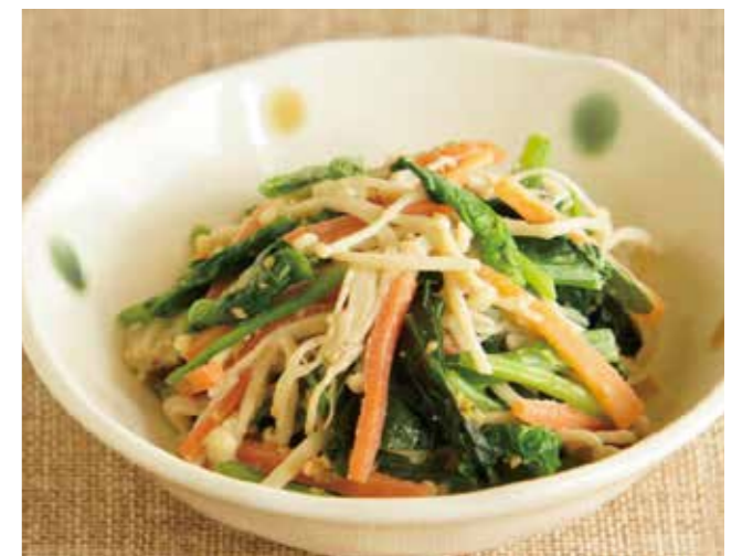
ほうれん草とえのきのマヨごまあえ