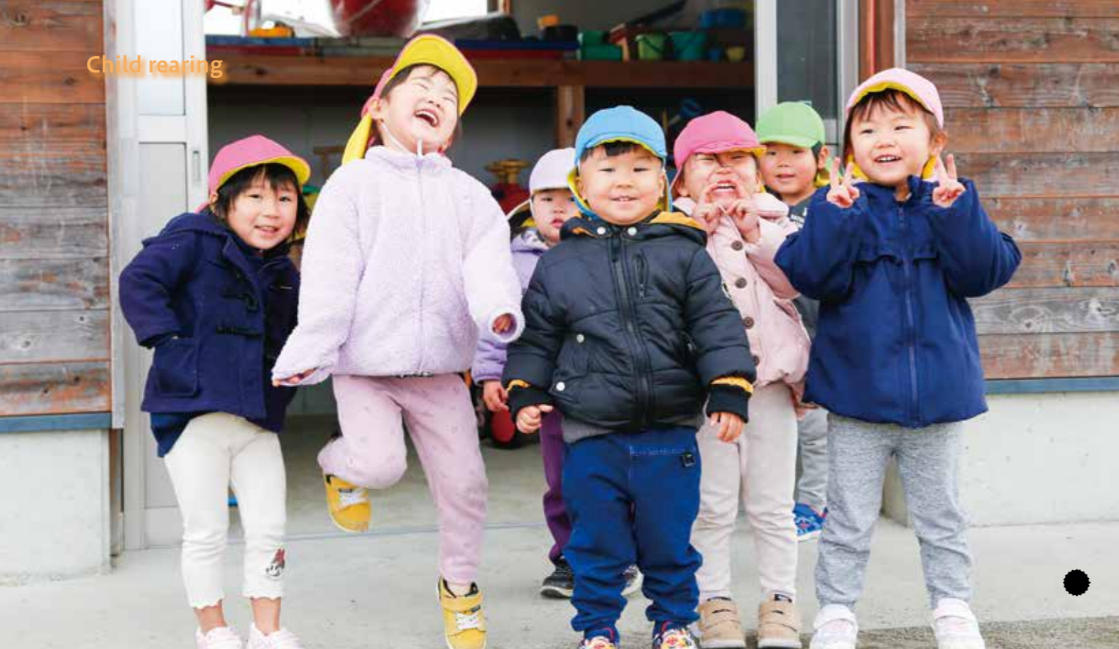
子どもたちが笑顔でいられるまちを目指して