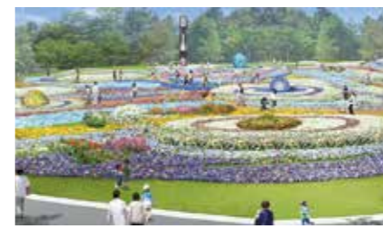
水辺エリア(水前寺江津湖公園)