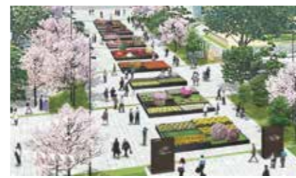
街なかエリア(熊本城公園・花畑広場)

熊本市内の3つのメイン会場と、県内全市町村の緑豊かな場所がパートナー会場となり、花と緑で彩られます。