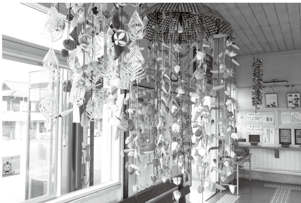
毎年恒例の「七夕飾り」。手づくりの飾りを「さげもん」にして飾っています。