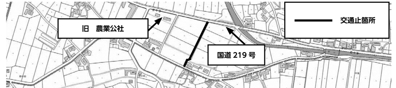
建設水道課(水道係)