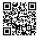
地方税お支払いサイト