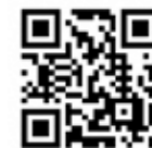
人吉球磨広域行政組合HP