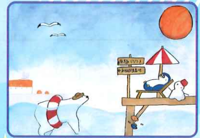
那須良輔大賞 【ジュニア部門 (中学生)】 「ようこそ!! 南極リゾートへ」