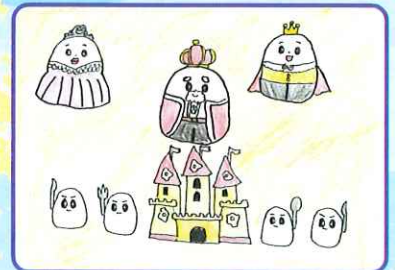
湯前町長賞 【ジュニア部門 (小学生)】 「こうきゅうたまご」