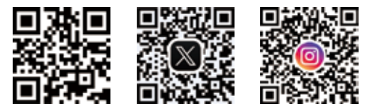
ホームページ X (旧Twitter) Instagram

改修工事のため美術館は休館中です。教育課事務室・ミュージアムショップは利用できます。ご迷惑をおかけしますが、ご理解をよろしくお願いいたします