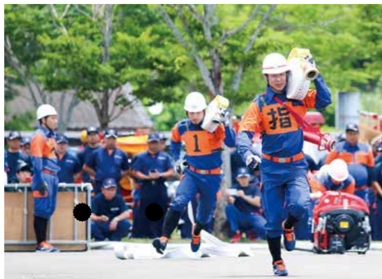
ホースを担いで懸命に走る

ましたが、令和2年7月豪雨や新型コロナウイルス感染症などで中止が続き、6年ぶりの開催となりました。本町からはポンプ車操法の部に第2分団第1部(上下染田)が、小型ポンプ操法の部に第4分団第3部(馬場)が出場。第2分団第1部は前回大会で逃した優勝を、初出場と