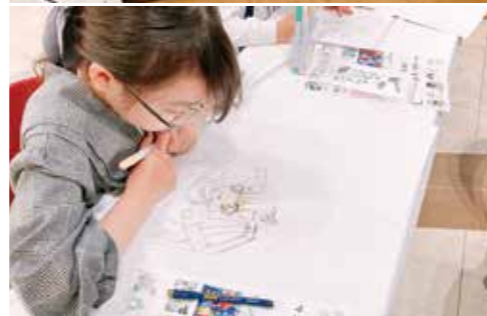
昨年の展示とワークショップの様子