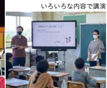
いろいろな内容で講演