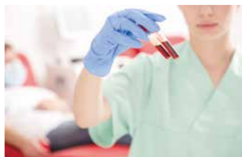
肝炎ウイルス検査では採血を行います