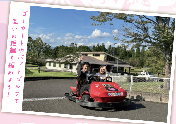
ゴーカートやパットゴルフで互いの距離を縮めよう!

誰もが優しくなれる場所 — KUMA であなただけの ラブストーリー — 恋物語を始めよう!