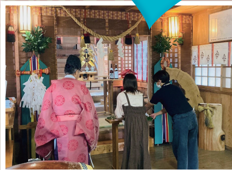
恋愛成就のパワースポット・里宮神社に参拝!

球磨郡の9つの町村が一体となって、「結婚したい人」「パートナーを見つけたい人」を応援する球磨郡結婚対策推進協議会主催の婚活イベント。今回は湯前町で開催します。一緒にパン作り体験やアクティビティで楽しい時間を過ごしなが、新たな出会いを見つけましょう。