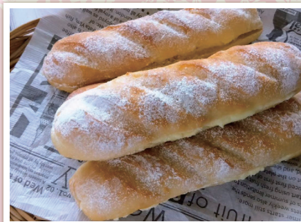
男女で協力しながら米粉のパンづくり挑戦!