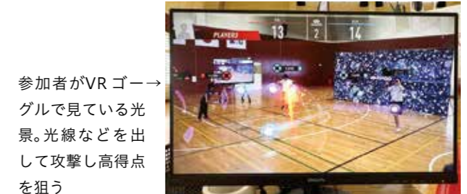
参加者がVRゴーグルで見ている光景。光線などを出して攻撃し高得点を狙う