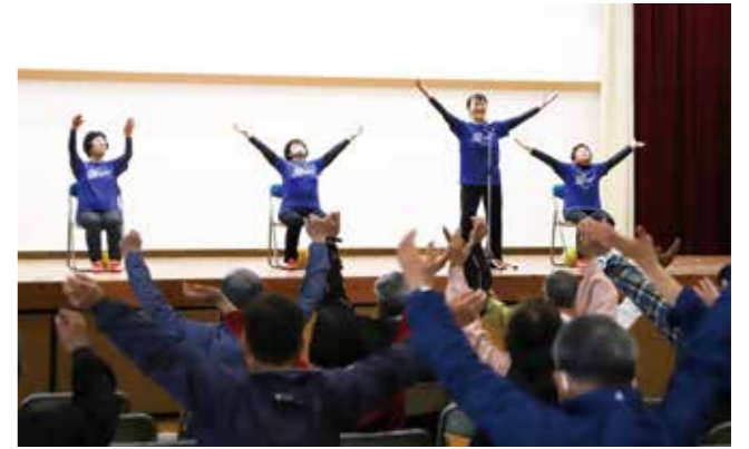
1. 座ってできる運動を披露した3B体操教室。来場者も音楽に合わせて体を動かした。2. フラワーアレンジメントや書道などの作品が会場を彩った