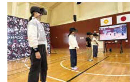
←機械を身に付けていざ対戦！

会と、世代を超えた交流の場を創るために開催しました。これからもまちの皆さんに「楽しい」と思ってもらえるような活動を続けていきます。参加された皆さんありがとうございました！