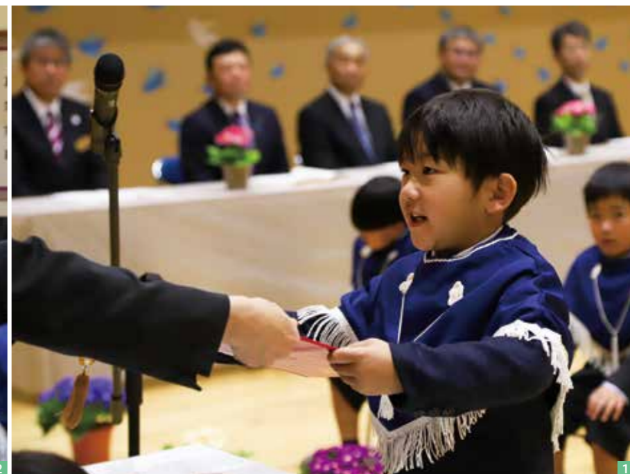
1_ 園長から成長の証を受け取る 2_ 受け取った卒園証書を感謝の言葉とともに保護者へ手渡した 3_ 将来の夢を画用紙いっぱい描き、大きな声で発表 4_ 園で過ごしたわが子の晴れ姿を記録と記憶に刻む 5_ 保育士らによる花道を笑顔でくぐる卒園児と保護者。笑顔と涙であふれた 6_ 卒園児12人で歌う最後の歌。涙を吹き飛ばすような元気いっぱいの声が会場に響いた