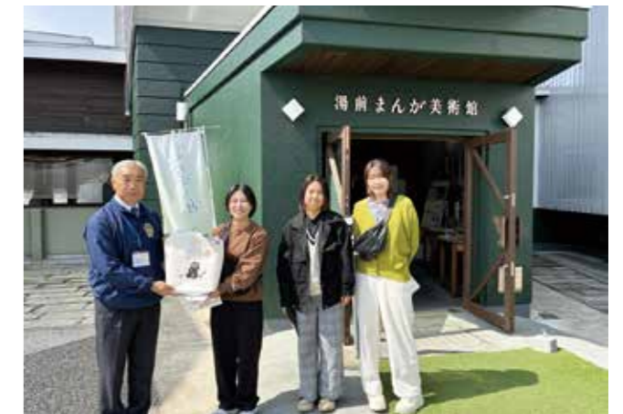
1万人突破を記念して、美術館グッズ詰め合わせをプレゼント！

みに来られたそうです。まんが美術館では、本年度もさまざまな展示を開催予定！ぜひ公式SNSやホームページをチェックしてみてくださいね。