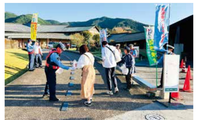
湯楽里来館者に交通安全グッズを配り、事故防止を呼びかけた

への来館者を対象に交通安全を呼びかけるキャンペーンを実施。反射たすきやチラシを配布し、交通事故の防止を呼びかけました。