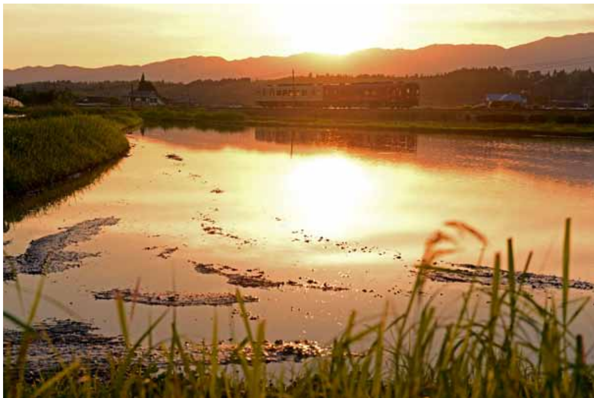
くま川鉄道「田園シンフォニー」

風が心地よくなびき、青々と深まる緑。 夏が近づくとともに長くなる日の暮れ。 暑さから涼しさに変わり始めるその時、 金色の水面を駆ける田園シンフォニー。 このまちでは四季折々の楽しみが待っている。 今日も見つけてみよう。湯前の良いところを。