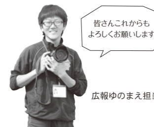
広報ゆのまえ担当