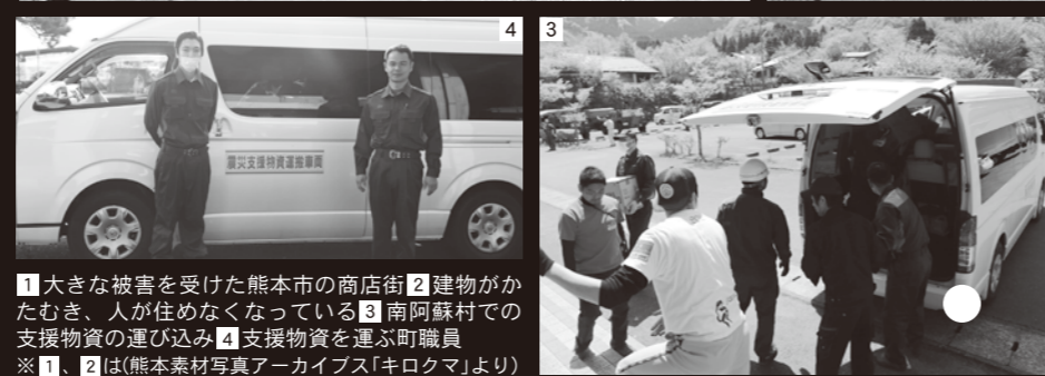
1大きな被害を受けた熊本市の商店街 2建物がかたむき、人が住めなくなっている 3南阿蘇村での支援物資の運び込み 4支援物資を運ぶ町職員 ※1、2は(熊本素材写真アーカイブス「キロクマ」より)