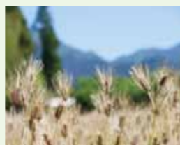
「音」に注目して歩いてみるのもおもしろいかもしれません

自然の音で季節を感じられるとはなんとも贅沢。これから私にとって初めて迎える湯前の夏。いろいろな自然の音を聞けると思うととても楽しみです!