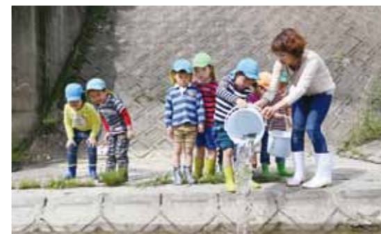
「大きくなってね」と願いを込めて放流する園児