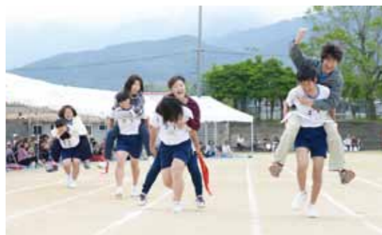
笑顔で協力してゴールを目指す親子