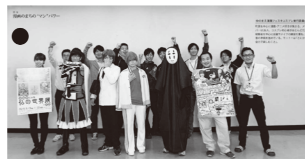
湯前の漫画のこだわりを紹介した特集「漫画のまちの“マン”パワー」

5月10日、日本広報協会が平成28年度全国広報コンクールの審査結果を発表し、「広報ゆのまえ」が広報紙・町村部で全国2位となる一席を受賞しました。同コンクールは、昭和39年から各自治体の広報活動のレベルアップを目的にして開かれ、広報紙（都道府県・政令指定都市・市・町村）、ウェブサイトを（都道府県・政令指定都市・市・町村）、映像、広報企画の5媒体12部門に各都道府県の代表503点が集まりました。