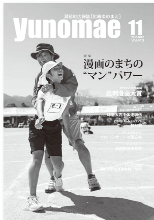
全国一席を受賞した広報ゆのまえ平成27年11月号の表紙

5月10日、日本広報協会が平成28年度全国広報コンクールの審査結果を発表し、「広報ゆのまえ」が広報紙・町村部で全国2位となる一席を受賞しました。同コンクールは、昭和39年から各自治体の広報活動のレベルアップを目的にして開かれ、広報紙（都道府県・政令指定都市・市・町村）、ウェブサイトを（都道府県・政令指定都市・市・町村）、映像、広報企画の5媒体12部門に各都道府県の代表503点が集まりました。