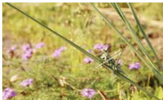
作り物とは思えないほど高い完成度のバツタ