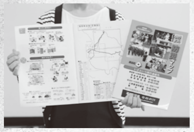
昨年各家庭に配られた防災マップ

昨年に各世帯に配られた防災マップには、町内の避難所の一覧、いざというときの連絡先など災害時に役立つ情報が載っています。湯前町役場総務課にも置いてあります。