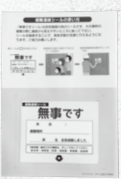
いち早い救助につながる「無事ですシール」

災害発生時には防災マップの裏表紙にあるシールを道路から見える場所に貼ってください。家具の固定や非常持ち出し品などの事前の準備と自分の判断が大切です。危ないと思ったらすぐに避難してください。