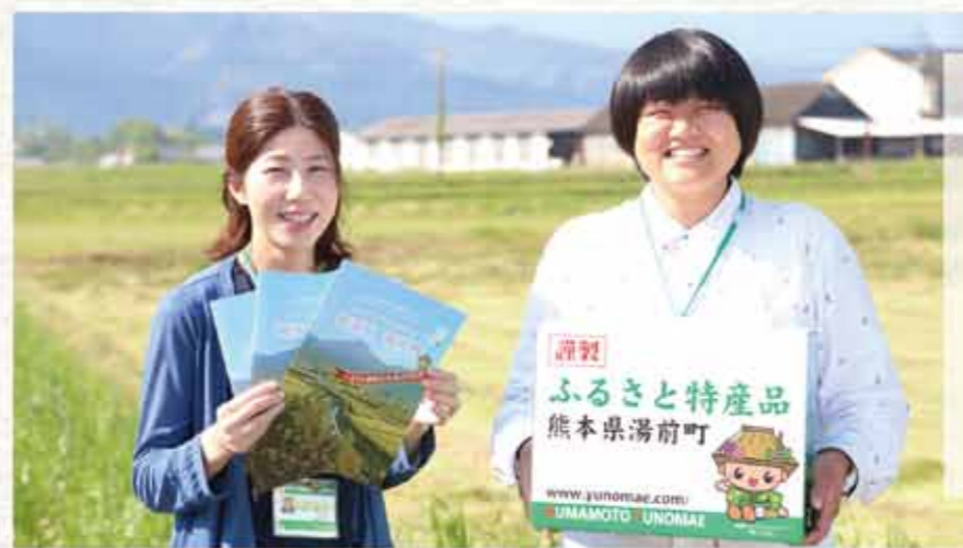
町外の知り合いに紹介してみませんか!?

ふるさと納税として、平成28年3月までに、のべ359人から961万円もの寄附をいただきました。いただいた寄附金は「活き活きと輝き、誇れる町ゆのまえ」の実現に向け、活性化の大切な財源として、使わせていただきます。