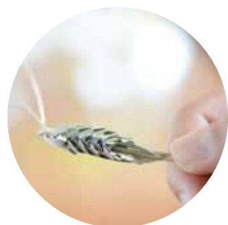
一番難しいところはお腹の部分で、編み込むのが難しいそうです

葉ツタやわらじなど手作りの物には、その人にしか表現できない温かさがありません。個性あふれる手作りの物を、皆さんも作ってみてはいかがでしょうか?