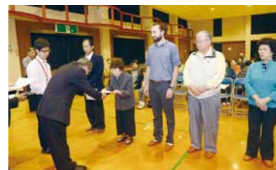
中村教育長から委嘱状を受け取る講師