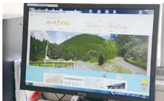
湯前で暮らすための情報を見ることができる