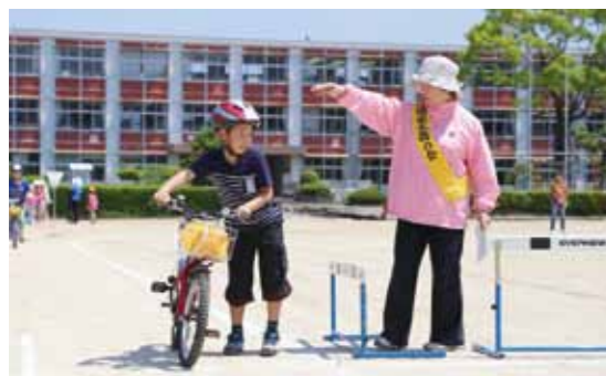
自転車を降り、左右を良く確認する園児