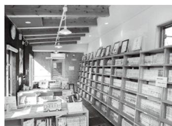
まんが図書館で人生の教科書が見つかるかもしれません