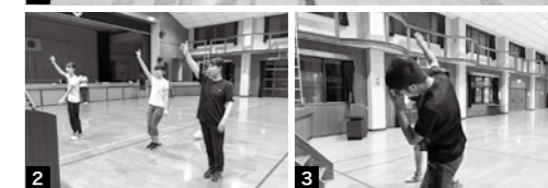
1 県青年祭バドミントンで2位となったメンバー 2 3 パートごとに分かれてダンスの練習、文化祭まであとわずか