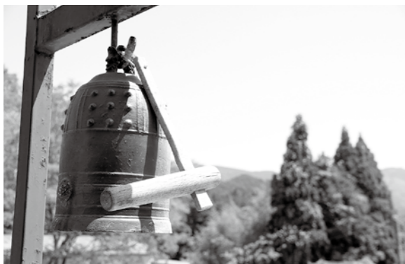
外にかかっている半鐘は4つ、浅鹿野には杵もある

詰所にかかっていた鐘は「半鐘」と呼ばれ、危険をまわりに知らせるためのものでした。今では、火災が発生するとサイレンが鳴りますが、防災無線がなかったころは、半鐘を使って火事を知らせたそうです。あるおじさんは「火事があったときは、現場に一番近い詰所がとにかく連打しよった」とのこと。