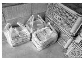
ビニール袋に入れて出された新聞紙

人吉球磨では、資源ごみ(衣類・雑誌・新聞・ダンボール)を、ひもで十文字に縛って出さなければなりません。最近、ビニール袋に入れたものやガムテープでまとめたものが見られます。