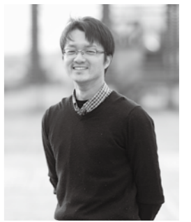
レールウイング複合施設管理責任者