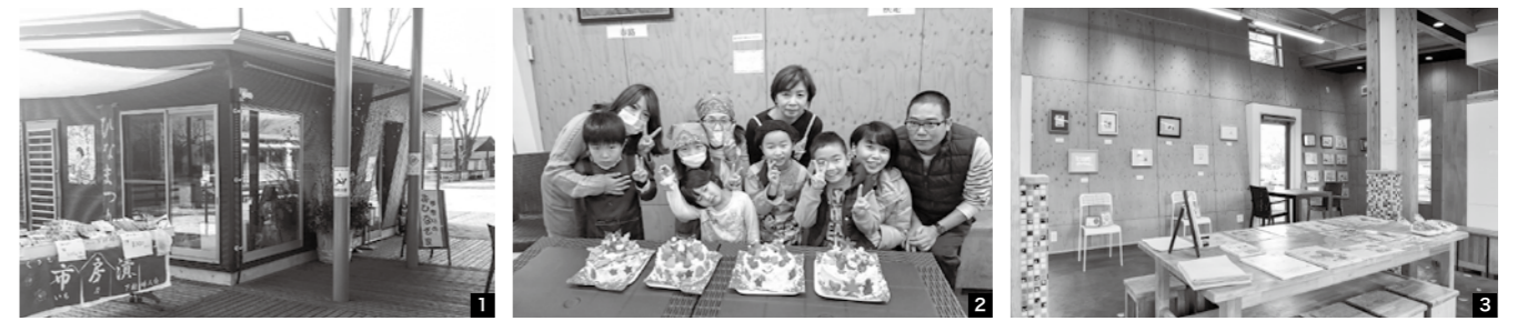
1 現在開催されているひなまつりの展示のよこでは、不定期で下村婦人会の販売も開催。施設は一般の住民も利用や販売が可能 2 ユノカフェとコラボし、親子でクリスマスケーキづくり 3 本年度3回開催したユノバー。地元球磨焼酎がおしゃれなカクテルに変身

ア ロマ講座やキッズ向けプログラミング教室、ユノカフェのランチ付き工作体験など、展示体験販売施設では月1〜2回以上イベントを行っています。現在開催されている、ひなの会のひなまつり展をはじめ、おさる画伯やわらじの会、書道、写真など芸術作品の展示、夜には焼酎カクテルを提供する「ユノバー」も定期的に開いてきました。 八代市や鹿児島県から施設の利用申込があり、毎月ハーバリウム体験も開催しています。一日中施設を開けているので自由に立ち寄れるスペースになっています。隠れた特技を持つ町民の皆さんの技を披露する場や、ちよつとした会議などでも気軽に施設を利用してほしいです。