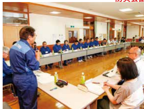
関係者に協力を依頼する長谷町長