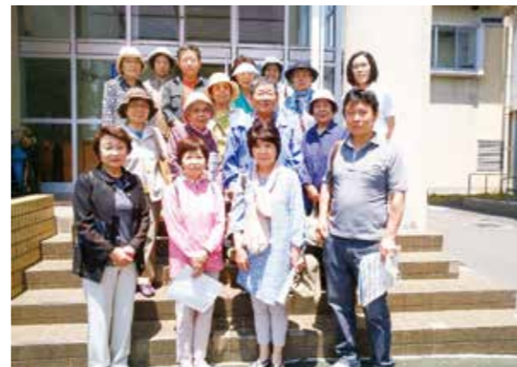
ごみ分別への意識を高めた中里2区の皆さん