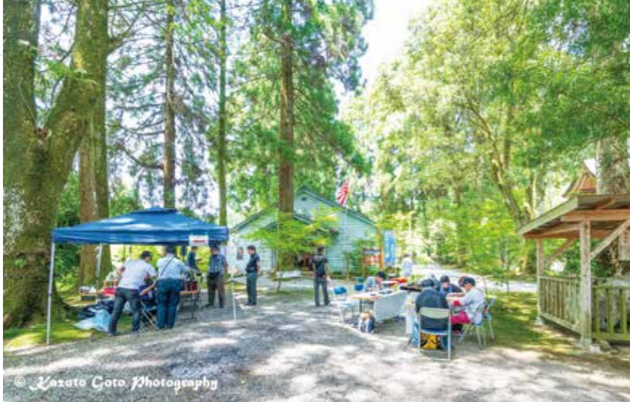
アニメが足を運んでもらうきっかけに