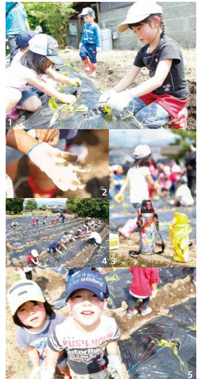
1_「頑張るぞ」と気合を入れる園児 2_軍手は土色に 3_こまめに水分補給 4_クラスごとに一列で 5_表情は生き生き

帽子に長靴姿の園児たちは水筒をぶら下げ、園から歩いて畑へ移動。さんさんと太陽が降り注ぐ中、こまめに水分をとりながら「頑張るぞ」と気合を入れて、イモを元気に植えていきました。