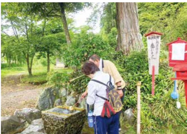
夏の湯前もキレイです