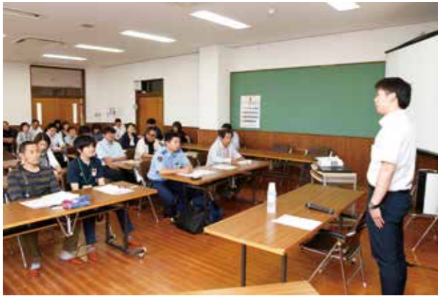
徳永さんの説明に聞き入る会員