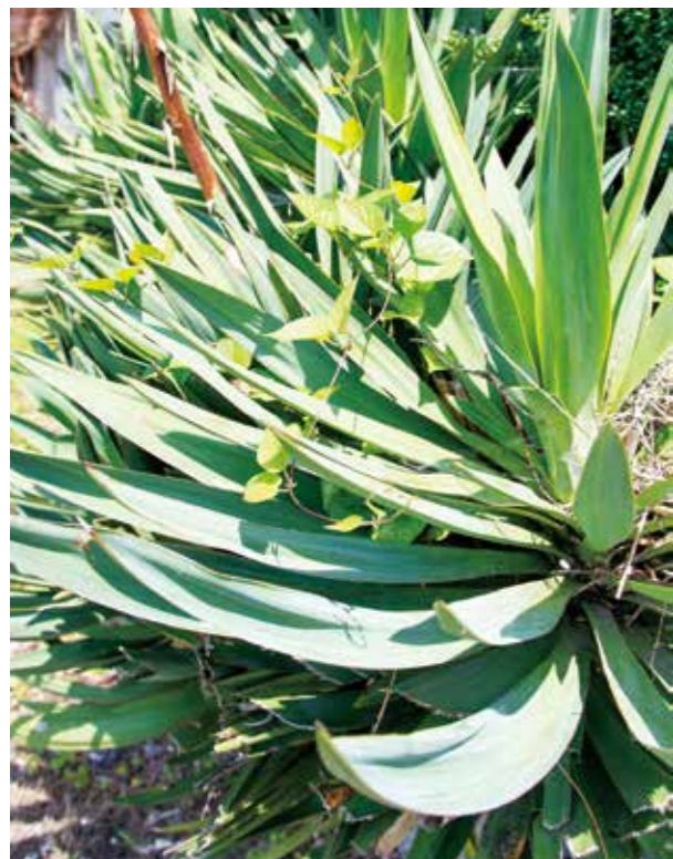
事故防止に協力をお願いします