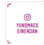
Instagramで読み込んで活動をチェック