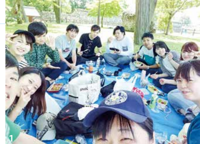
1、3_おいしい空気を吸い、みんなで食べる手作り弁当は格別 2_おいしくなれと心を込めて焼きそばを焼く団員