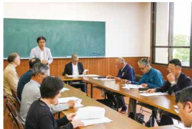
今後の事業計画や予算案を審議する会員ら