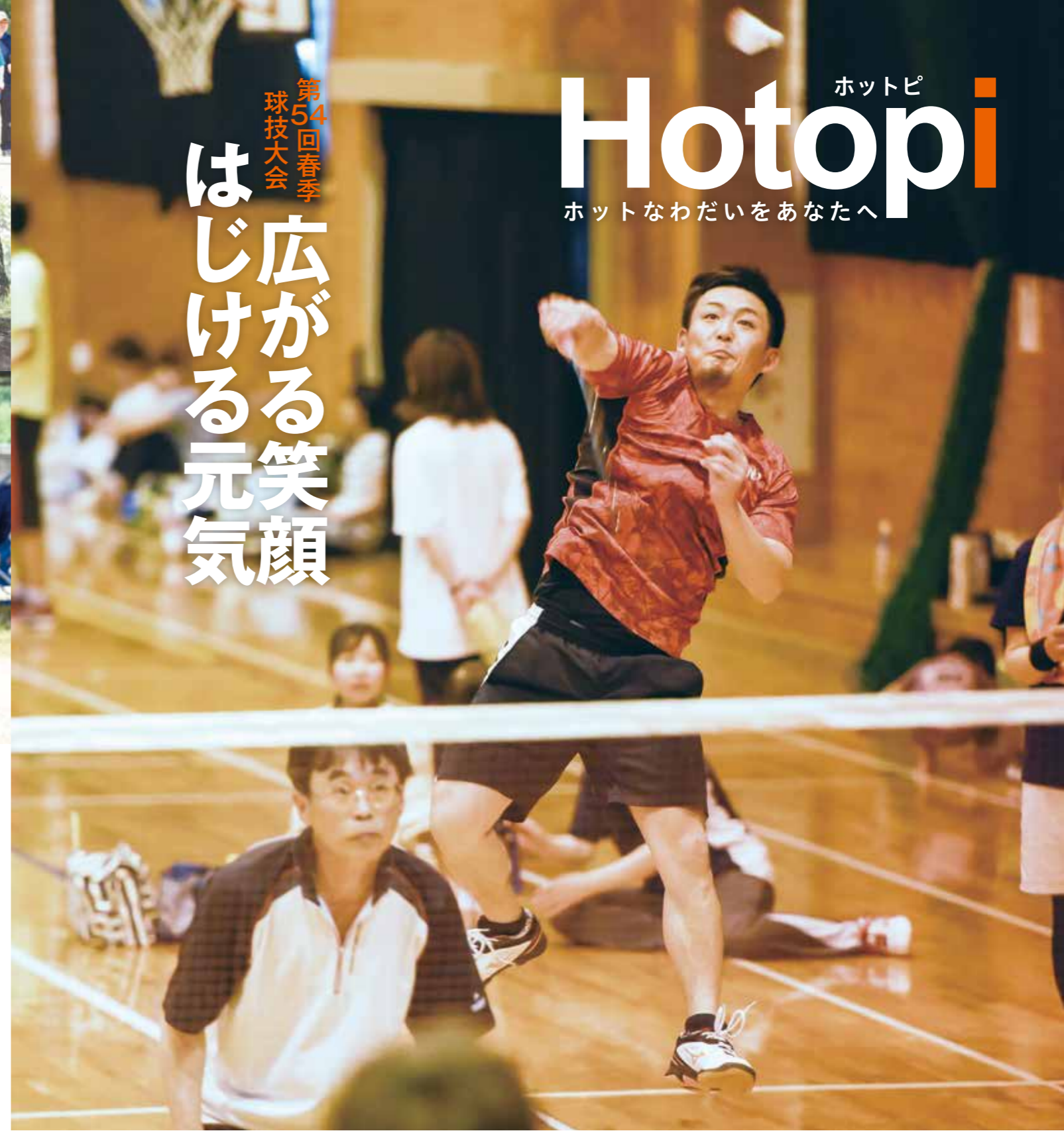
目の覚めるような強烈なスマッシュ