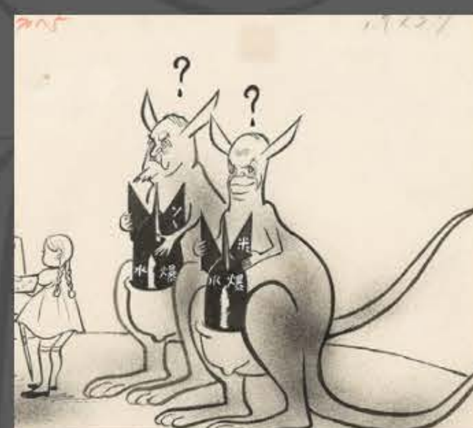
「おろかなる獣たち」